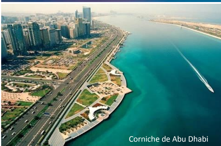
Corniche de Abu Dhabi