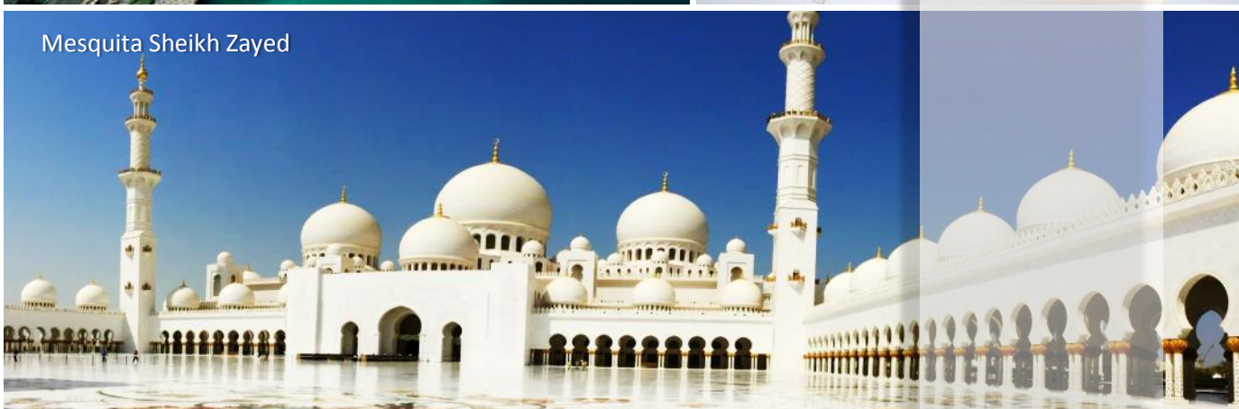
Mesquita Sheikh Zayed