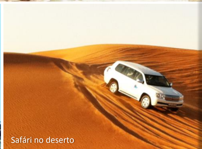
Safári no deserto